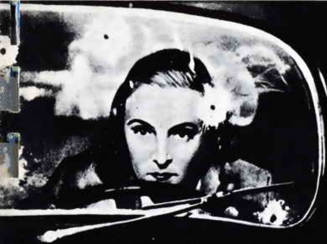
Вот она, эта съемка со стрельбой. Кадр из фильма «Секретная миссия».